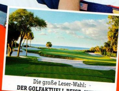
Die große Leser-Wahl: - DER GOLFAKTUELL REISE-AWARD